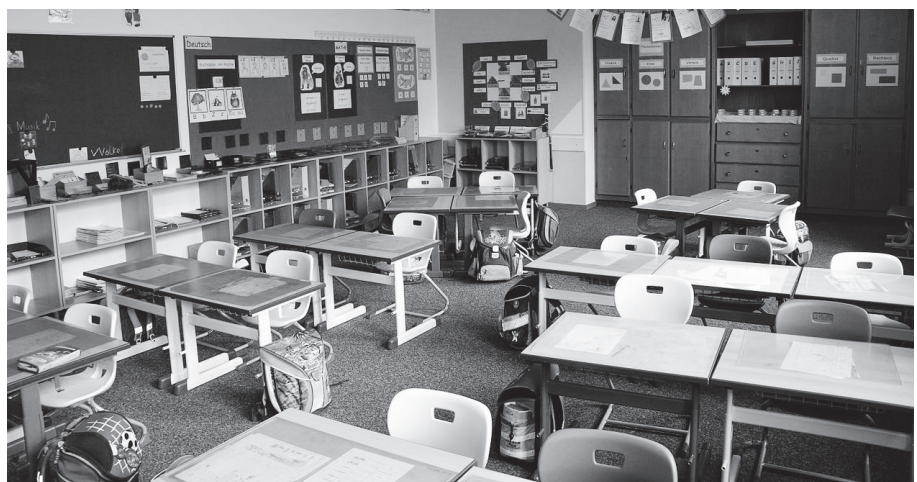
Schulräume/Klassenzimmer der privaten katholischen Grundschule im Haus St. Marien in Neumarkt in der Oberpfalz.

■ Ein Letztes ist anzumerken: Als Praktikantin bzw. Praktikant oder als Lehramtsanwärterin bzw. Lehramtsanwärter braucht man sich nicht ausnutzen zu lassen. Diese Unsitte ist noch nicht ausgestorben. Weder für Ihre Mentorin oder Ihren Mentor noch für den Pfarrer noch für die Gemeinde sollen Sie in die Bresche springen, wenn diese ihrerseits zu erkennen geben, dass es ihnen mit der Sache des RU nicht mehr ernst ist oder dass Frust und Resignation ihre Tätigkeit bestimmen.